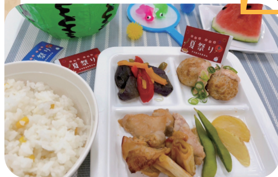
◎献立 とうもろこしごはん 焼き鳥風 たこ焼き 夏野菜のマリネ スイカ

当院では隔月でプレートランチを提供しています。今年は全国各地で祭事や花火大会が再開される夏となり、患者さまにも楽しくお祭り気分を感じて頂けるよう、夏食材を使用した献立を、福山夏まつりの開催日に合わせて提供しました。